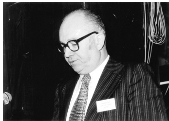
UNIOPSS, 15e Congrès (Le Touquet, 1975)