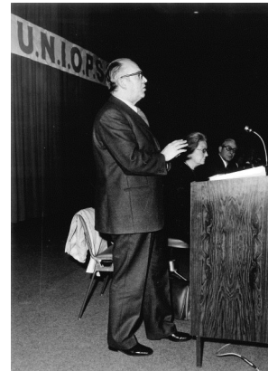
UNIOPSS, 14e Congrès (Marseille, 1973)