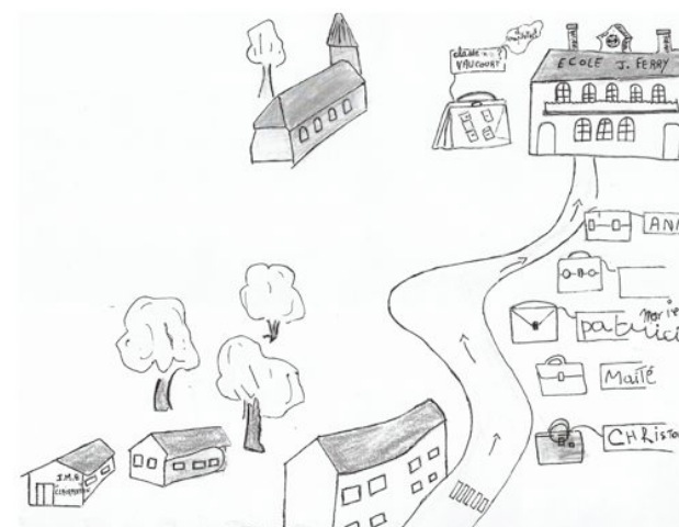
Le chemin de l'Institut Médico Pédagogique à l'École Jules Ferry du quartier... Dessin d'enfant 1983-1985 (IMP Clairmatin AEIM 54-Vandoeuvre)

Judi 15 octobre 2015 - 9h à 17h. ATELIER CANOPÉ de Meurthe-et-Moselle 95 rue de Metz – NANCY