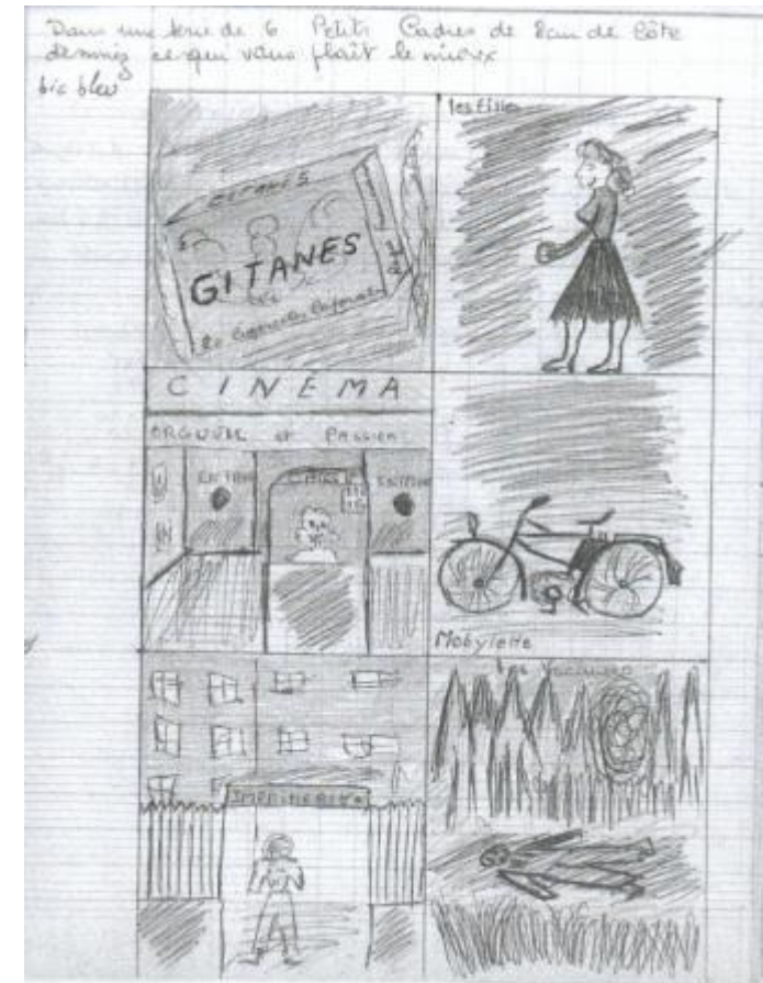
Extrait d'un dossier de jeune placé au centre d'observation de Savigny-sur Orge, années 1950