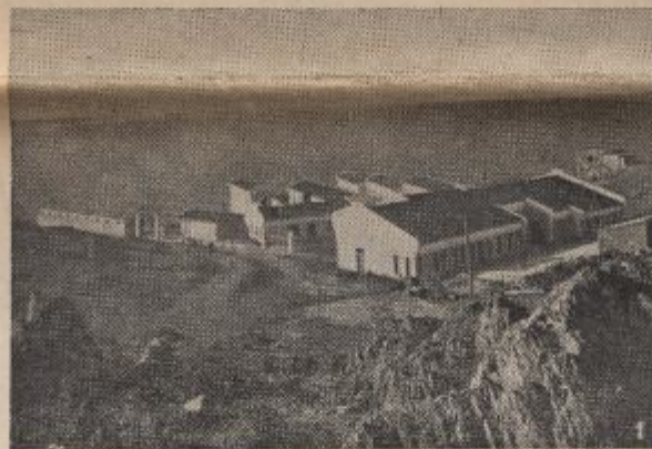
VUE GÉNÉRALE DE L'INSTITUT

L'Institut dispose de quatre grands dortoirs de 20 lits chacun. Une salle de douche, des labavos et W. C. attenants à chaque dortoir, complètent la série de ces divers pavillons aérés, offrant le maximum de sécurité et de salubrité à nos jeunes pensionnaires.