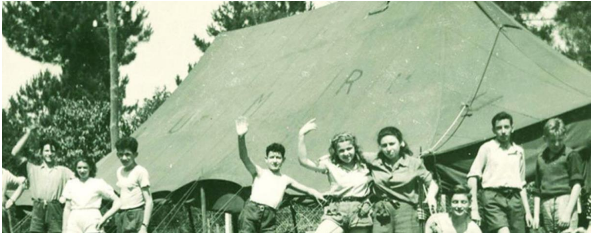
Colonie de Tarnos, CCE, s.d. ( www.ville-tarnos.fr/les-colons-de-tarnos-héritiers-de-la-résistance-juive )

Histoire de la Commission centrale de l'enfance (CCE) depuis 1945.