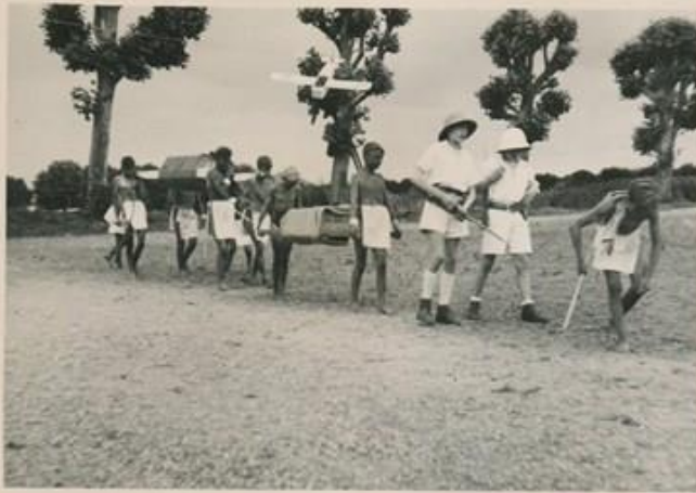
dans la brousse avançant les Blancs