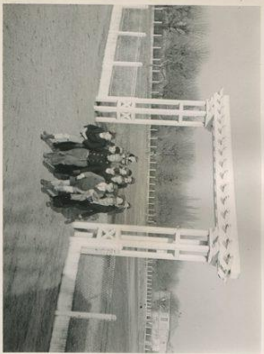
me! deary! me! deary! me! deary!