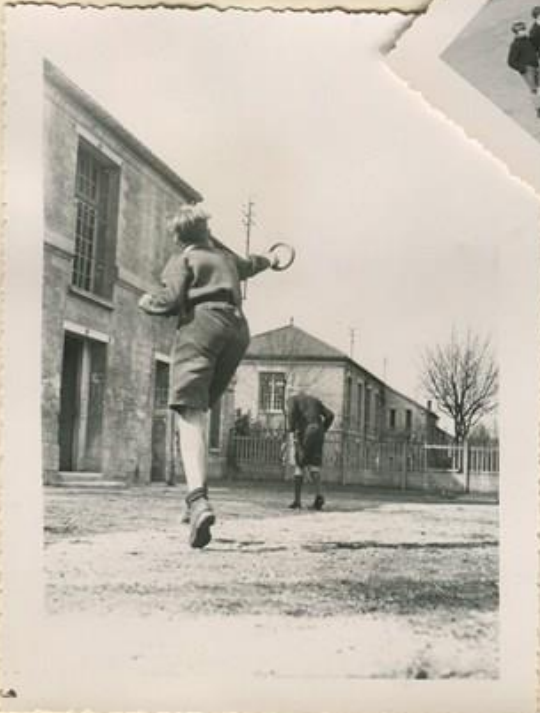
deck - tennis