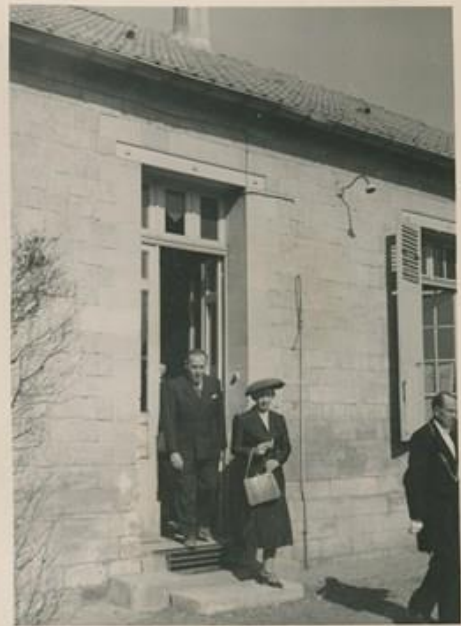
Madame Vincent Auriol