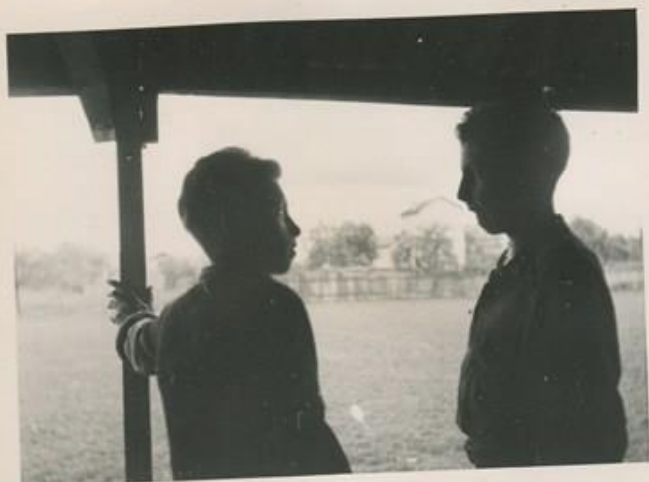
Ceux qui attendent