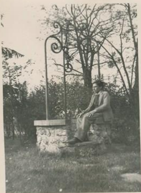
le soleil après la pluie l'été après le printemps le dimanche après le jeudi le vrai après le faux