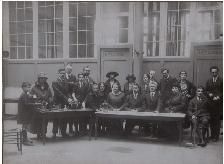
Henri Wallon et ses collaborateurs dans le laboratoire de psycho-biologie de l'enfant à Boulogne-Billancourt